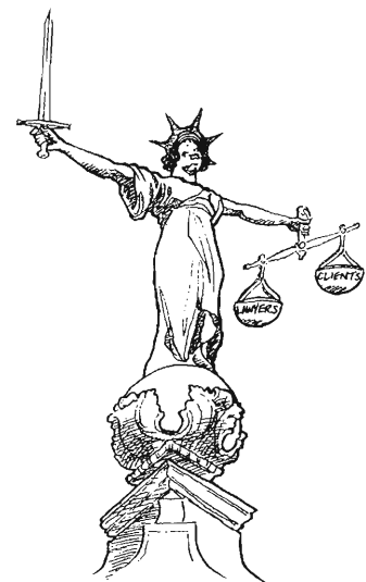
From Steuart & Francis Queen's Counsel (London)