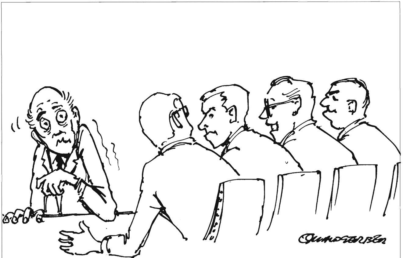
Grilling during oral exam