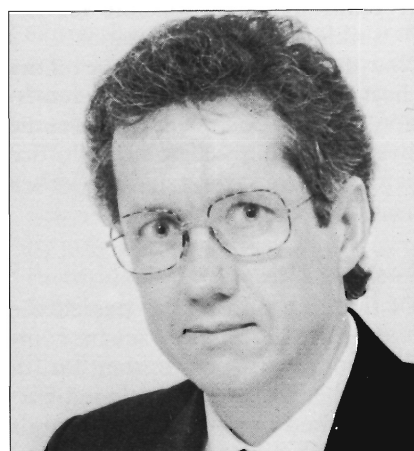
CG Marnewick SC .....